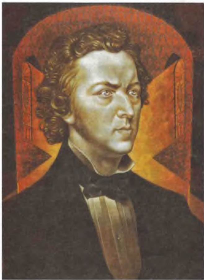
Портрет Фредерика Шопена. 1937

помнить, что ни одно из искусств не может и не должно порывать связь, святую связь с математикой. И как в своё время цифры были святыми символами, полными глубокого смысла для Пифагора, так и теперь надо вновь вернуть эти мудрые понятия каждого числа.