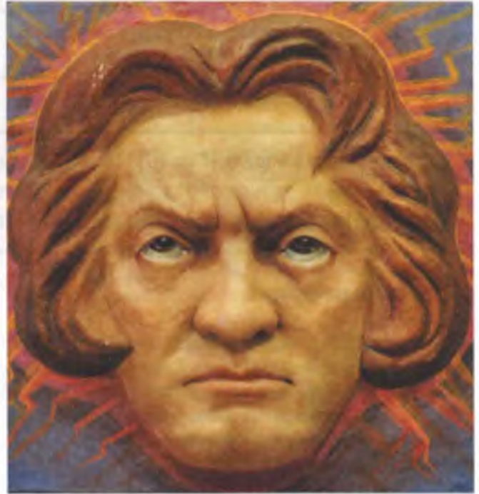
Бетховен (барельеф II). 1960

7 Согласно антропософии, в человеческом существе заключено семь принципов, или составных частей. Тело человека строится из физического тела, жизненного (эфирного) тела, астрального тела и «Я» — зерна души. Перерабатывая своим «Я» астральное тело, человек создаёт пятую основную часть своего состава — Манас, которому Р. Штайнер, чтобы не повторять популярные в Теософском обществе индийские термины, дал название «Geisteselbst» — Самодух. Духотело — духовное «Я» или «Дух в «Я». Перерабатывая своим «Я» эфирное (жизненное) тело, человек создаёт шестую часть своего существа — Будхи, или, согласно Р. Штайнеру, — «Lebensgeist» (Жизнедух). Будучи развиты, Манас и Будхи представляют собой преобразённые астральное и эфирное тела человека. Высший же дар, который может получить человек на Земле, — это способность управлять своим дыханием, преобразовать кровь, проследить работу нервов и управлять процессом мышления. Тот, кто достиг этой ступени, считается Адептом, человеком, который образует в себе седьмой член человеческого существа — Атму, преобразованное «Я» физическое тело. Итак, согласно антропософии, у каждого человека сформировалось четыре части его состава. Пятая в настоящее время сформировалась частичным образом, шестая и седьмая — в зачатке.