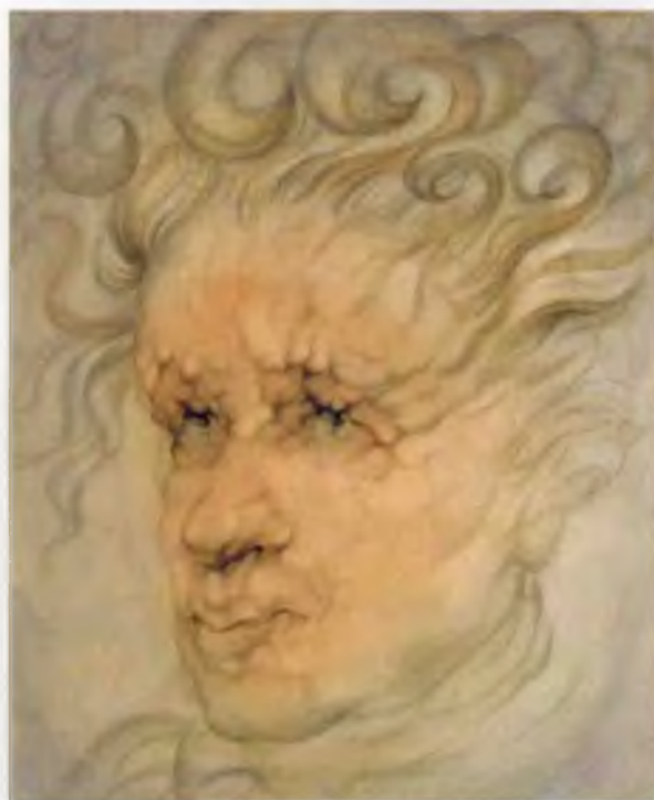
Я слышу! 1962