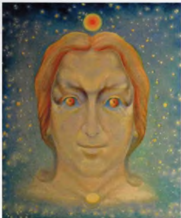
Деметра (Вселенная). 1980