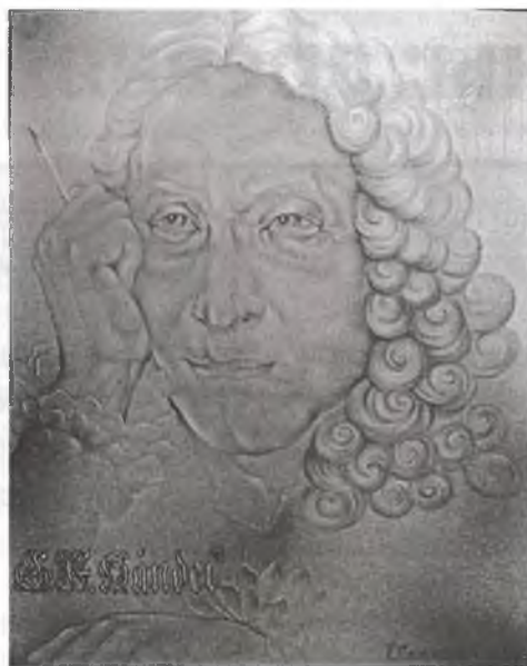
Георг Фридрих Гендель

Выдающийся немецкий и английский композитор эпохи барокко Гендель открыл новые перспективы в развитии жанра оперы и оратории. В своих произведениях он предвосхитил многие музыкальные идеи последующих столетий – оперный драматизм Глюка, гражданственный пафос Бетховена, психологическую глубину романтизма. Перед Генделем преклонялись многие композиторы (в их числе Бетховен). В своём эссе «О Генделе и англичанах» Бернард Шоу писал: «Для англичан Гендель не просто композитор, но объект культа. Скажу больше – религиозного культа!.. Гендель обладал даром