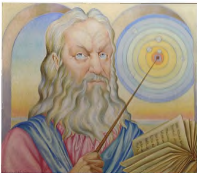
Клавдий Птолемей. 1977