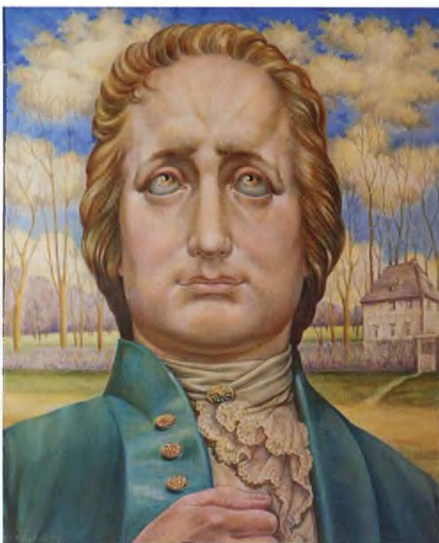
Вольфганг Гёте. 1974