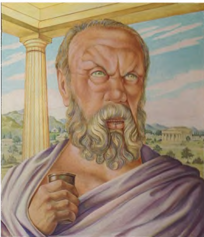
Последнее слово Сократа. 1976