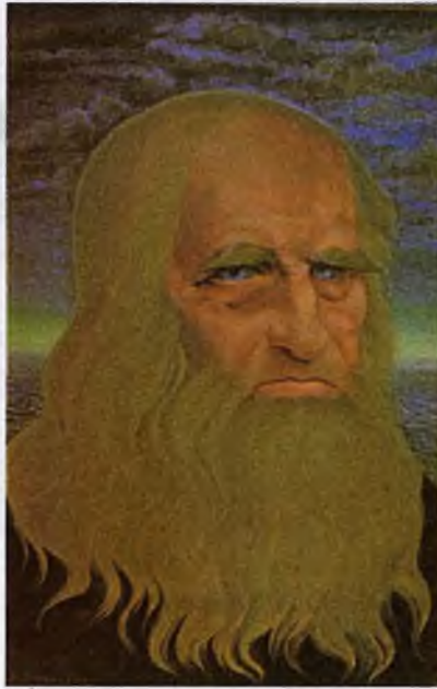
Леонардо да Винчи. 1928

Особое место среди образов великих людей занимает портрет « Брунетто Латини », написанный Евгением Спасским в 1983 году. В отличие от титанов человеческой мысли и творчества он, возможно, мало известен широкому кругу читателей. Однако Данте Алигьери упоминает его в числе знаменитых флорентийцев, которые создавали «блестящий народный язык», в начале своего трактата «О народном красноречии». А в 15-й песне «Ада» говорит о нём как об одном из своих учителей. Нам же интересен тот факт, что когда Брунетто Латини, будучи послом Флоренции в Испании, возвращался