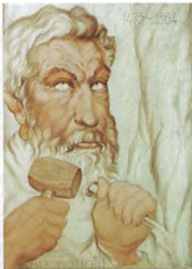
Микеланджело Буонаротти за работой. 1965

В России с подобной по масштабу личностью можно сравнить лишь Михаила Ломоносова, основателя совре-