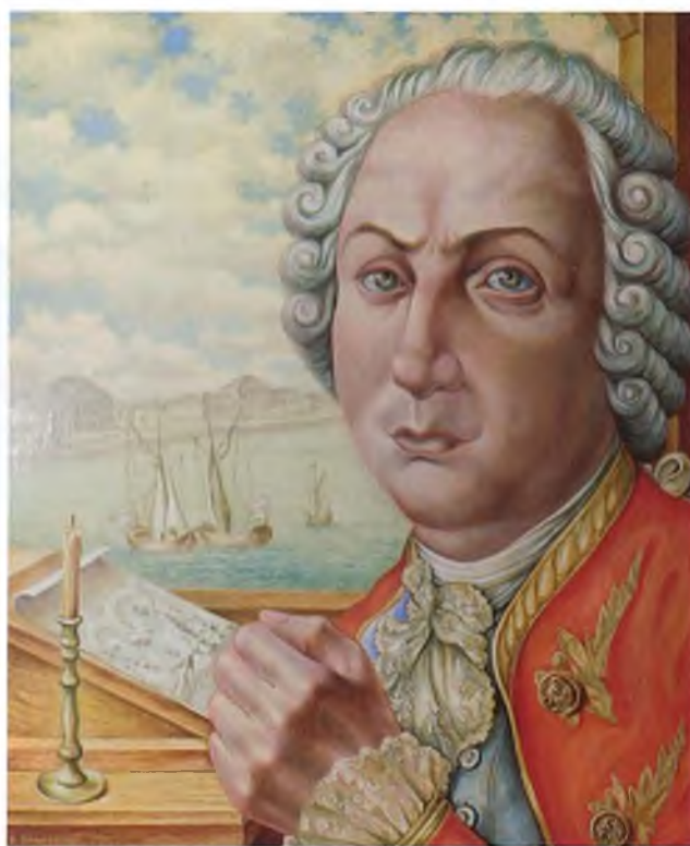
Михаил Ломоносов в Петербурге. 1976